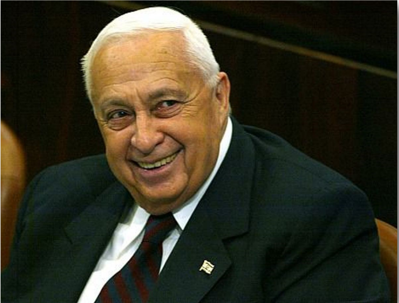
Elfde premier van Israël Ariël Sharon

Ariël Sharon werd op 26 februari 1928 in Ramat Gan geboren als Ariël Arik Sheinerman. Hij was een Israëliisch militair en politicus van 17 februari 2001 tot en met 11 april 2006 de premier van Israël.