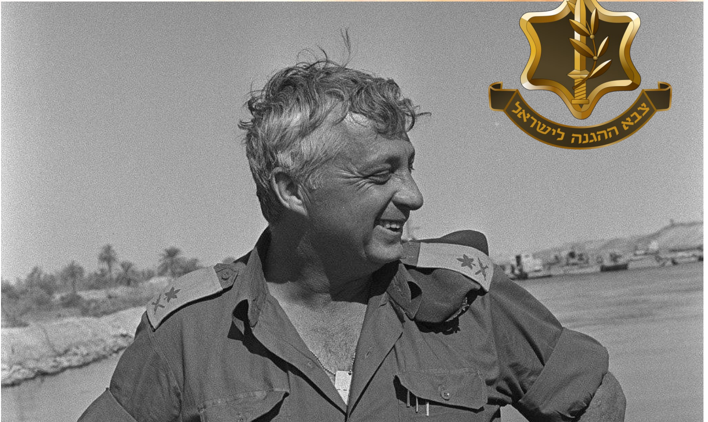
Generaal Ariël Sharon