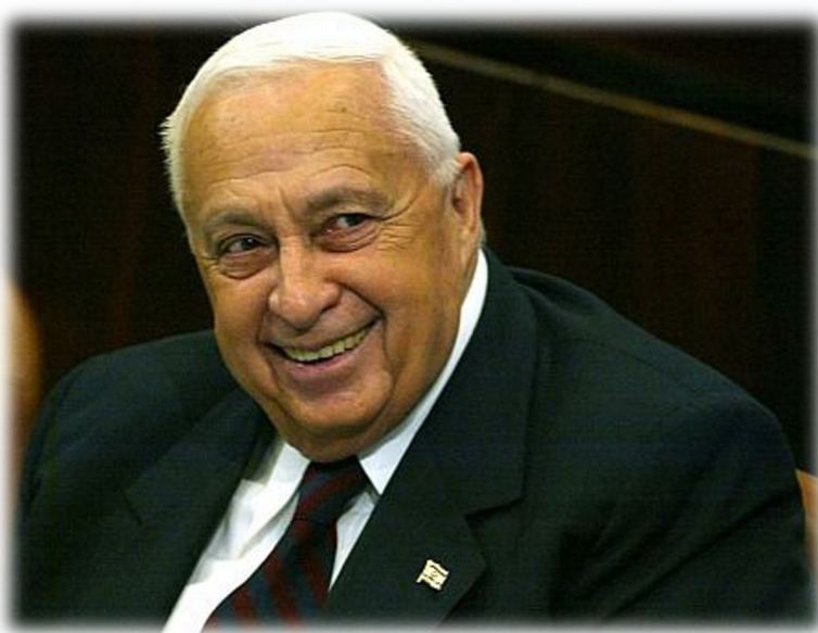
Premier Ariël Sharon