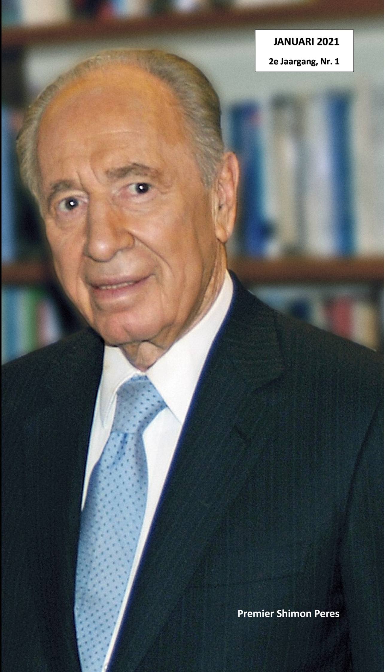
Premier Shimon Peres