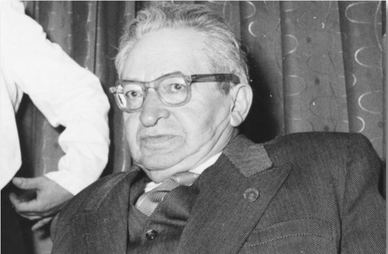
Tweede president van Israël Yitzhak Ben-Zvi

Yitzhak Ben-Zvi werd op 24 november 1884 in Poltava (Oekraïne) geboren als Isaak Sjimselevitsj. Hij was een geschiedkundige en een van de leiders van de Joods-socialistische beweging in Palestina. Ben-Zvi was actief in de Joodse zelfverdediging tegens pogroms in Oekraïne en in de Arbeiderspartij Zion.