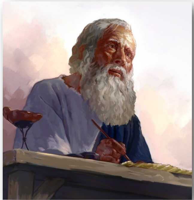
Johannes op Patmos

Mijzelf niet; maar de Vader, die in Mij blijft, doet Zijn werken. Geloof Mij, dat Ik in de Vader ben en de Vader in Mij is: of anders, geloof om de werken zelf" (Yochanan/Johannes 14:7-11). "