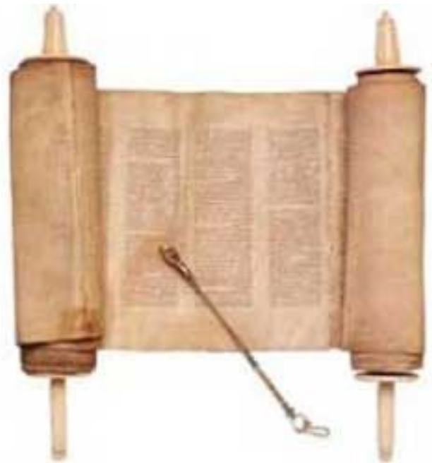
Thorarol met een zilveren yad

Dit artikel is afkomstig uit het maandblad Hadderech van november 2020 (Thea Ornstein)