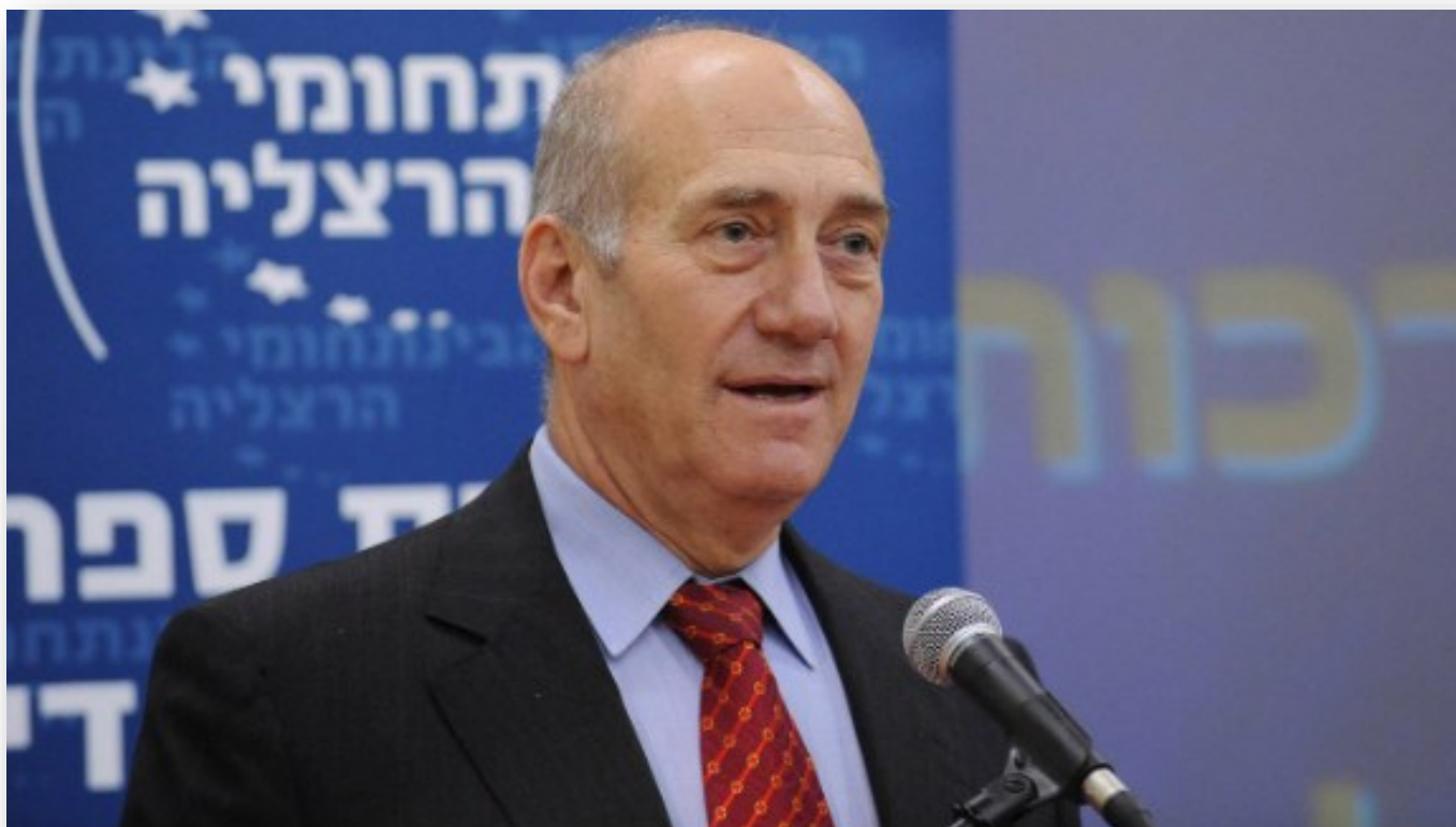
Twaalfde premier van Israël Ehud Olmert

Ehud Olmert geboren op 30 september 1945 in Binjamiena, Mandaatgebied Palestina, is een voormalig Israëliisch politicus van de Likoeid en Kadima partij en tevens de 12e premier van Israël vanaf 2006 tot en met 2009.