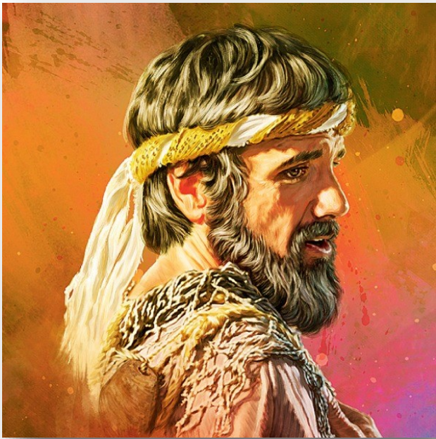
Petrus die vecht tegen angst en pijn

[...] Zo zien wij Hem bijvoorbeeld in Marcus 1:35 het ochtendgebed zeggen, in het Hebreeuws Shacharit genaamd: “Vroeg in de ochtend, toen het nog helemaal donker was, stond hij op, ging naar buiten en liep naar een eenzame plek om daar te bidden.” (NBV). In Ma’asim (Handelingen) 10:9 komen we het middaggebed tegen, in het Hebreeuws Mincha genaamd: “De volgende dag, toen de mannen onderweg waren en Joppe al naderden, ging Kepha (Petrus) het dakterras op om er te bidden. Het was ongeveer twaalf uur.” (Groot Nieuws Bijbel).