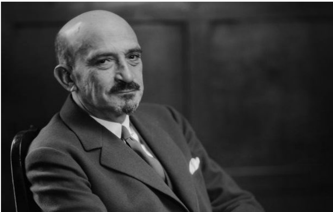
Eerste premier van Israël Chaim Weizmann

Chaim Azriel Weizmann is geboren in Motal (Rusland) op 27 november 1874 en was een Israëlich-Brits politicus en wetenschapper. Hij is vooral bekend als de eerste president van Israël, maar was tevens hoogleraar in de scheikunde.