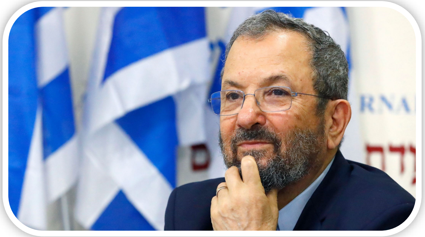
Tiende premier van Israël Ehud Barak

Ehud Barak werd op 12 februari 1942 in Misjmar Hasjaron geboren. Barak, militair van beroep, was van 1991 tot 1995 opperbevelhebber van het Israëliisch defensieleger (I.D.F.) en werd daarna politiek actief. Hij was in 1995 minister van Binnenlandse Zaken, minister van Buitenlandse Zaken van 1995 tot 1996 en 2000 en minister van Defensie van 1999 tot 2001 en van 2007 tot 2013. Ehud Barak was partijleider van de Arbeidspartij van 1997 tot 2001 en van 2007 tot 2011.