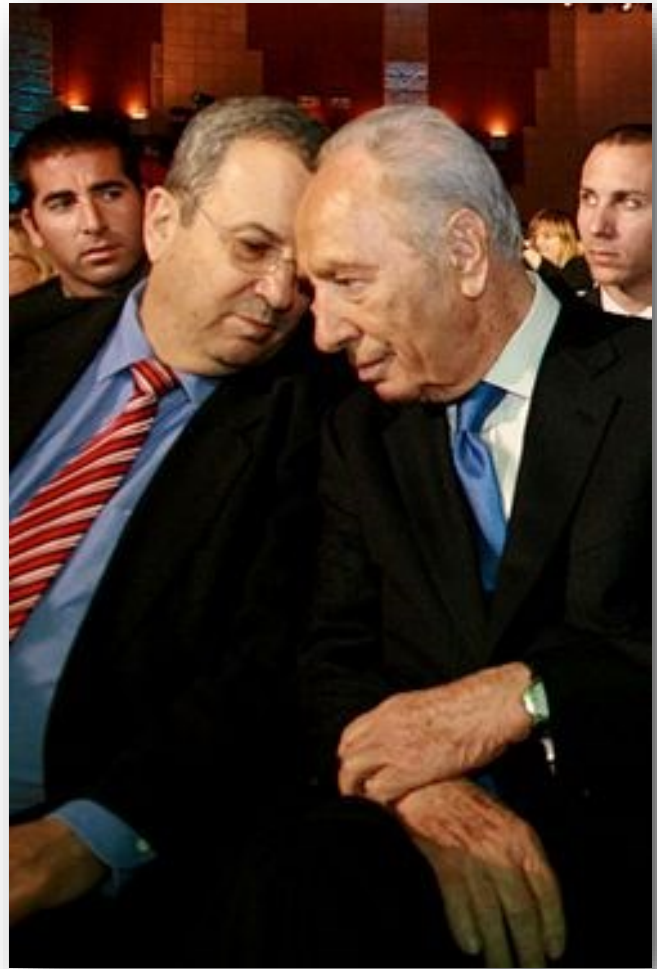
Ehud Barak met Shimon Perez

Dit was in antwoord op de terugtreding eerder die dag van de Minister van Defensie, Moshe Ya'alon, die als reden daarvoor verklaarde het in moreel en professioneel opzicht sterk oneens te zijn met de premier (Netanyahu). Barak kondigde op 27 juni 2019 aan terug te willen keren in de politiek en met een nieuwe partij mee te willen doen aan de algemene verkiezingen van 17 september. Hij zei dat het hoog tijd is om een eind te maken aan het "corrupte leiderschap" van premier Benjamin Netanyahu en suggereerde samen te willen werken met centrum- en linkse partijen.