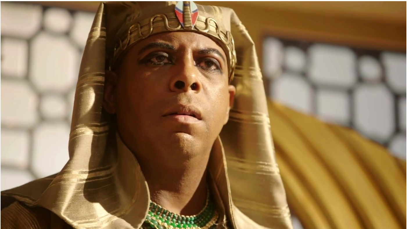
De Farao van Mitzraïm (Egypte)