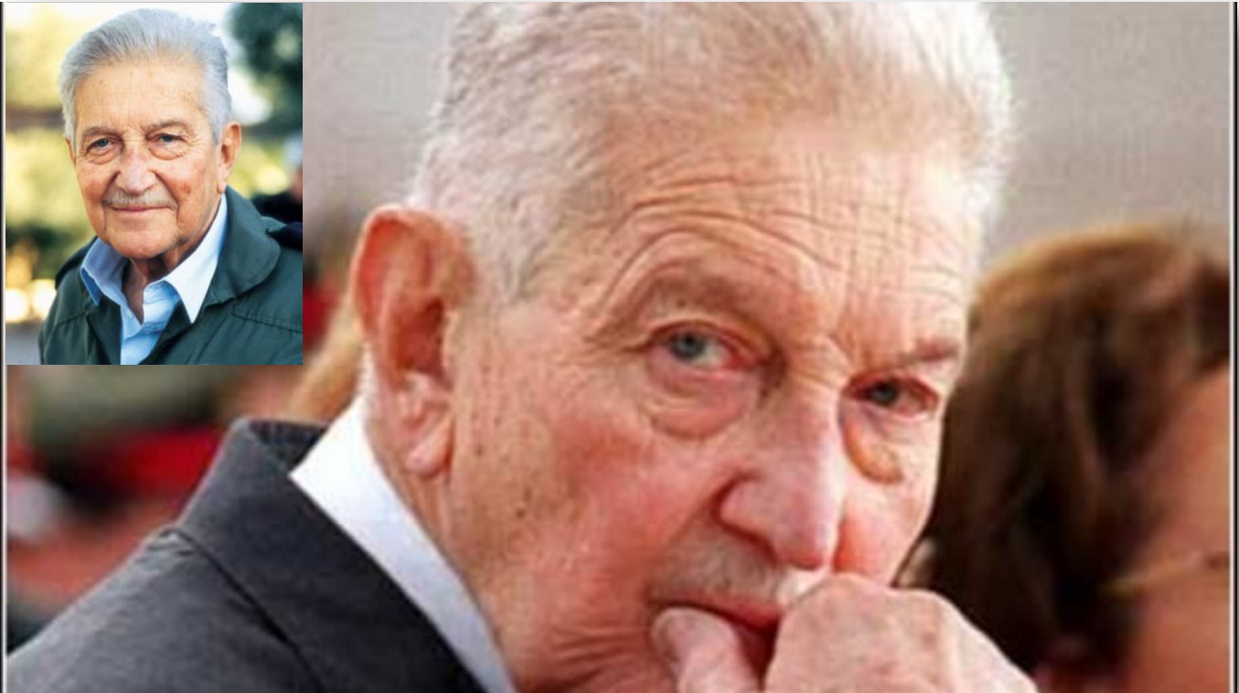
Zevende president van Israël 1993-2000 Ezer Weizmann