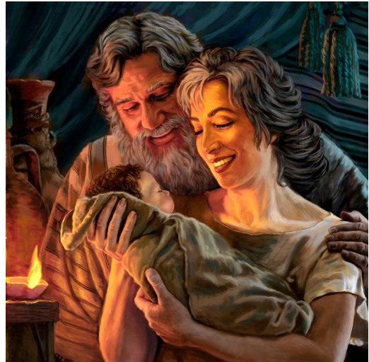
De geboorte van Yitzhak

Waarom zou hij zijn eigen zoon wegsturen? Voor Ismaël zal het overigens ook niet makkelijk zijn geweest. Hij was al een jaar of 17 en zag dat zijn positie in gevaar kwam. Yitzhak was immers het kind van Sarah, de belangrijkste vrouw in het huis van Awraham. En de relatie tussen Hagar, zijn biologische moeder, en Sarah was waarschijnlijk al niet geweldig. Maar dan stelt G'd Awraham gerust: "Laat het niet kwaad zijn in uw ogen, over de jongen, en over de dienstmaagd; al wat Sarah tot u zal zeggen, hoor naar haar stem; want in Izak zal uw zaad genoemd worden. Doch Ik zal ook de zoon van deze dienstmaagd tot een volk stellen, omdat hij uw zaad is" (Bereshit / Genesis 21:12).