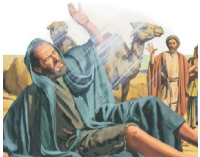
De apostel Shaul oftewel Paulus

Shaul (Paulus) schrijft hier nadrukkelijk dat een onbesneden gelovige uit de volken, die besneden is van hart en volgens de Torah leeft, als besnedenen dient te worden beschouwt!!! Als hij aan een bekeerde heiden van wie hij eerst geschreven heeft dat diens onbesnedenheid voor besnijdenis geldt, later alsnog de lichamelijke besnijdenis zou opleggen, dan zou Shaul zich hier zelf tegenspreken.