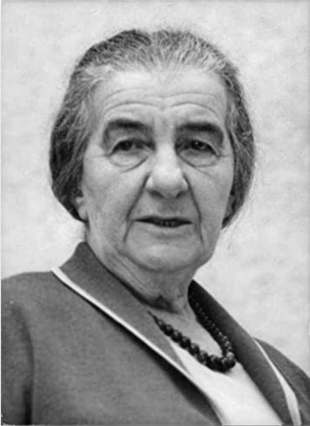
Vierde premier van Israël Golda Meir

De vierde premier van Israël, Golda Meir is als Golda Mabovitsj geboren op 3 mei 1898 in Kiev (Oekraïne) Rusland. Ze werd de Iron Lady genoemd.