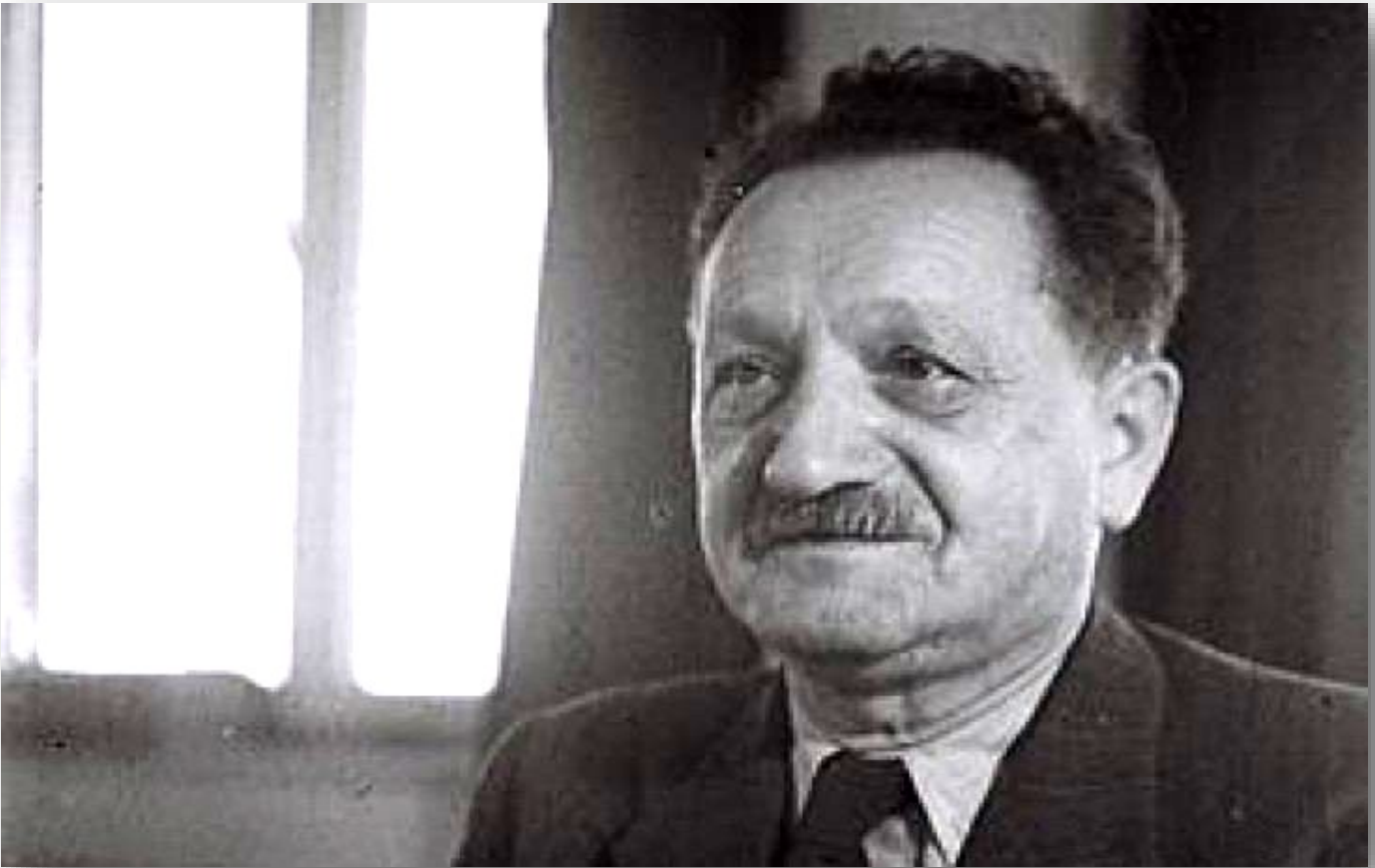
Tweede president van Israël Yosef Sprinzak

Yosef Sprinzak werd op 17 januari 1884 in Moskou (Rusland) geboren. Hij was in de eerste helft van de 20e eeuw een vooraanstaande zionistische activist, een Israëlische politicus en de eerste voorzitter van de Knesset, een rol die hij bekleedde van 1949 tot zijn overlijden in 1959.