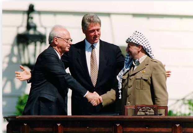
Vlnr: Yitzhak Rabin, Bill Clinton en Yasser Arafat

Ons leven gaat aangrijpend veranderen. In het verschiep liggen goed buurschap, het einde van het dodenleed dat onze huizen aandoet en het einde van de oorlogen. Laat de zon rijzen!". In 1994 ontving hij voor zijn inzet bij de akkoorden de Nobelprijs voor de Vrede, samen met Shimon Peres en Yasser Arafat.