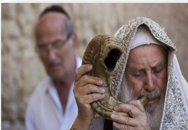
Het blazen van de shofar (ramshoorn)

Op beide dagen van Rosj HaSjana wordt er in de synagoge honderd maal geblazen op de shofar (ramshoorn). Als symbool voor een goed jaar worden veel zoete dingen gegeten. Traditioneel worden er stukjes appel, gedoopt in honing, aan elkaar aangeboden, waarbij men de ander een vruchtbaar (appel) en zoet/goed (honing) jaar toewenst.